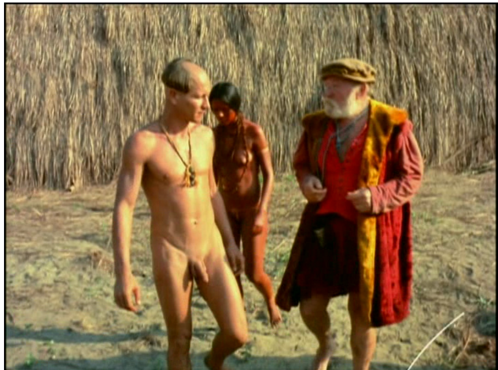
Fig.3: Culturas intercambiáveis em clima de liberdade.

A 'tribo' a que se refere Salem é formada pelo elenco e a equipe dos três filmes que o diretor ali produziu, Azyllo muito louco (1970), Como era gostoso o meu francês e Quem é Beta? (1972). Vivendo nesse retiro comunitário em estilo hippie, a tribo de Nelson continuava assim, a seu modo, a usufruir da liberdade ceifada pela virada política conservadora. Em Como era gostoso o meu francês , quase se pode palpar esse modo livre de viver. A liberdade sexual reivindicada pela antropofagia modernista a partir do símbolo fálico do pau-brasil encontra-se aqui anunciada desde o título do filme, que qualifica o francês de 'gostoso', num trocadilho entre o gosto de sua carne, saboreada no final por sua amante índia Sepoipepe, e seus atributos sexuais, que a câmera se deleita em evidenciar (figura 3).