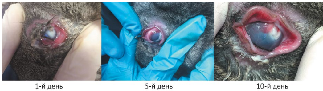
Рис. 1. Фотографии глаз кроликов, демонстрирующие развитие экспериментальной гнойной язвы (без лечения) на 1-е, 5-е и 10-е сутки после травмы