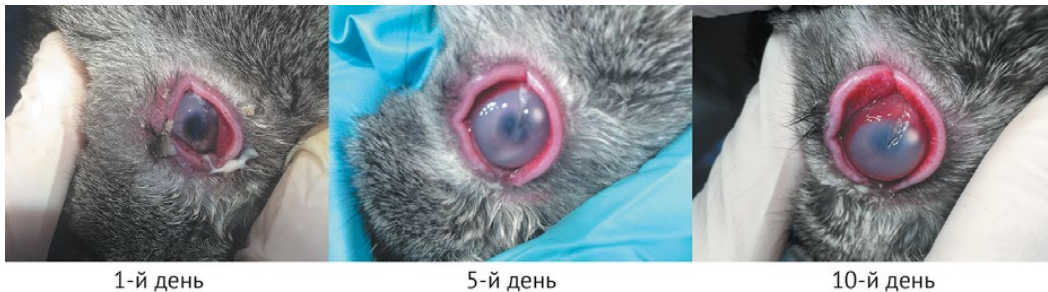
Рис. 2. Фотографии глаз кроликов, демонстрирующие развитие экспериментальной гнойной язвы (с лечением антибиотиком) на 1-е, 5-е и 10-е сутки после травмы

величины, гомогенной или мелкозернистой структуры.