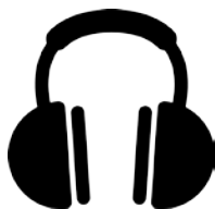
4; Imagen asociativa

continuas o discontinuas, en cuyo interior se incluye contenido textual que remite a diferentes tipos de contenidos. Su función es que el alumno identifique rápidamente qué tipo de información se le está dando y sepa cómo afrontar su aprendizaje. Con este cometido es común encontrar imágenes simbólicas o icónicas encabezando los enunciados de las actividades propuestas por los manuales de texto para clarificar qué tipo de procedimiento se espera del estudiante. Esta función suele ser llevada a cabo por iconos o códigos de colores y recuadros.