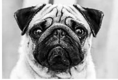
1; Imagen figurativa de "perro"

Puede afirmarse que las imágenes figurativas hacen auténticas traducciones de las palabras que acompañan. La diferencia es que no traducen las palabras a la LM del alumno, sino que las traducen al lenguaje visual. Esto no sólo favorece la comprensión de la palabra y el establecimiento de mecanismos asociativos que permitan la memorización de las palabras, sino que mejora la accesibilidad del conocimiento adquirido al evitar recurrir a la traducción literal en la lengua materna del alumno (Barrallo y Gómez 2009: 3).