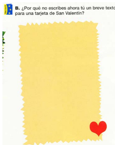
3 Aula internacional A1, pág. 24

b. Decorativa: Hacen los materiales de aprendizaje visualmente más atractivos. En la actualidad todos los materiales están atestados de diferentes tipos de imágenes cuya única función es hacer el material más atractivo al alumno. Aunque su inclusión está motivada en gran parte por fines comerciales, lo cierto es que su inclusión también tiene efectos pedagógicos (Fukushima et al. 2012). En muchas ocasiones este tipo de elementos visuales son formas abstractas de diseño moderno o que emulan entornos informáticos. También suelen utilizarse imágenes de naturaleza figurativa cuya función no es la de referenciar un significado concreto sino aumentar el atractivo de la presentación visual de un determinado material.