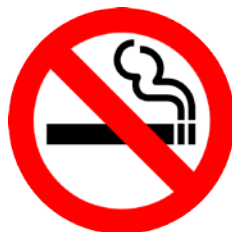
2; Imagen figurativa - icónica

Como se explicó anteriormente, aunque Goldstein (2012: 20) ubica los signos, símbolos e iconos en una categoría funcional propia y diferenciada, en este trabajo se propone que los signos, símbolos e iconos pueden cumplir diversas funciones. Una de ellas sería la propiamente figurativa, ya que en ocasiones representan metafóricamente un concepto abstracto o un referente concreto. En los manuales de español normalmente se utilizan únicamente símbolos convencionalmente aceptados en la sociedad de la LM puesto que se prevé que el alumno encontrará estos símbolos en una hipotética estancia en dicho entorno. Así, suelen recogerse señales de tráfico, leyendas utilizadas en mapas y planos de transporte público, símbolos que identifican edificios públicos o de interés turístico, etc. Su funcionalidad es similar a la de las imágenes figurativas y suelen utilizarse como facilitadores de adquisición de vocabulario.