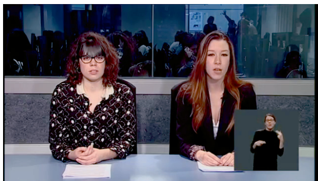
Imagen 5. Captura de pantalla de un informativo del taller de televisión signado