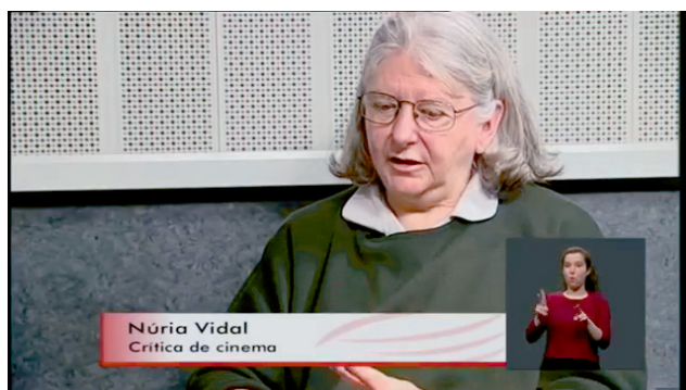
IMAGEN 6. Captura de pantalla de una entrevista del informativo de televisión signado